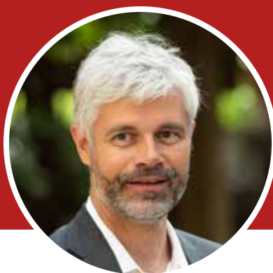
Laurent Wauquiez, Président Région Auvergne Rhône-Alpes

“ Auvergne-Rhône-Alpes est la grande région du sport. Nous avons la chance de pouvoir compter sur des fédérations et des clubs nombreux, dynamiques, qui font vivre les belles valeurs du sport, sur tous les terrains et dans toutes les disciplines. Chaque année, nous accueillons les plus grandes compétitions internationales et des tournois amateurs, tout aussi importants pour la vie de nos territoires. Et c'est ce savant mélange entre l'exigence du plus haut niveau et la convivialité du sport amateur que j'aime tant dans notre région.