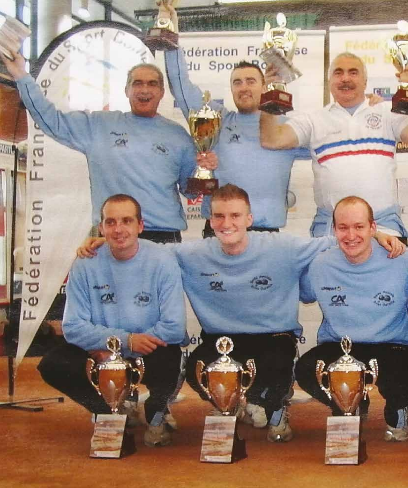
2008 : LA BOULE AMICALE DE BRIVES-CHARENSAC CHAMPIONNE DE FRANCE DES CLUBS SPORTIF